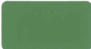
Island Green 0125 (0125)