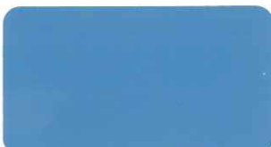
Pacific Blue 0315 (0315)