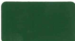
Green Jade 0776 (0776)