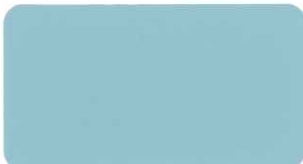
Sky Blue 5006 (5006)