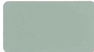
Grey 7005 (7005)