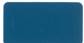
Royal Blue 0940 (0940)