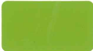
Orchid Green 8004 (8004)