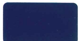
Blue 0138 (0138)