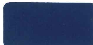
Signal Blue 0255 (0255)