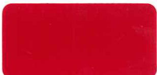
Signal Red 0256 (0256)