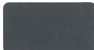
Charcoal Grey 0964 (0964)