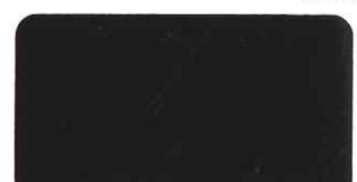
Dark Brown 0725 (3170)