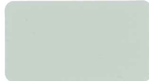
Light Grey 0767 (0767)