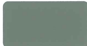
Dark Grey 0517 (0517)