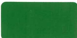
Signal Green 0257 (0257)